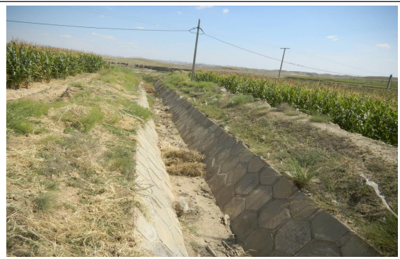
卧管出口明渠现状