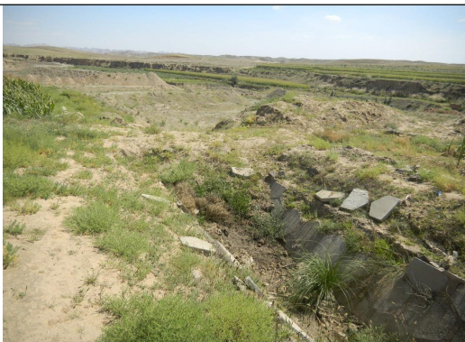
明渠部分损毁现状