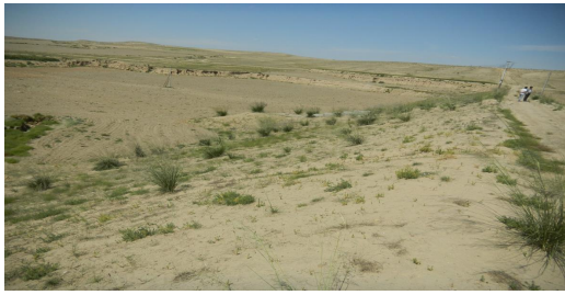
坝体上游坝坡现状